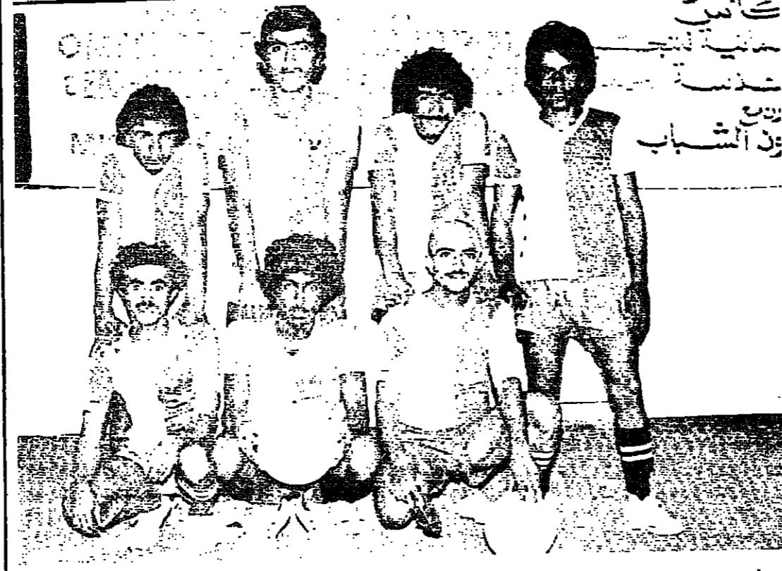
كأس جيب - حامية - حذنة - ربيع - من الشباب

الشرطة وطرحة باسناد الشرطة - يوم الثلاثاء ٢٥ ابريل - السيب وفتجا بملعب السيب. عمان وروي باسناد الشرطة. الساعة الرابعة اما مباريات استاد الشرطة فتلعب قسي الساعة الخامسة مساء.